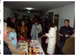
Ágape después de las confirmaciones

No sé qué harás tú allá en el cielo. Yo te pediría que movieras el corazón de aquellos que están entre los jóvenes; que entiendan que si alguien necesita esperanza, es el joven; si alguien ama el riesgo, es el joven; si alguien pincha la imaginación y se traslada a otras galaxias y es capaz de vibrar por la vida, es el joven.