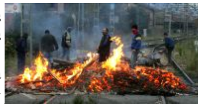
Mineros: Corte de tráfico

siempre más énfasis en garantizar rentas pasivas (prejubilaciones a edades muy tempranas) que en proporcionar a la juventud oportunidades reales de empleo digno y con futuro.