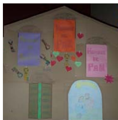
La casa del Adviento sobre el Belén

Amor, compartir, no tirar la comida, querer a la personas, comida para todos, estudiar, amar a mis padres, que los ricos compartan, que se acabe la guerra, que no haya armas, que haya justicia, que todos pue-