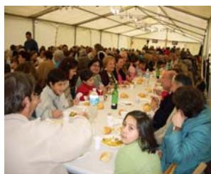
Comida en la carpa

Celebradas las fiestas de Santa Bárbara con una aceptable participación de la ciudadanía y con mucho entusiasmo y dedicación de todas las entidades implicadas en su organización y desarrollo, hay que felicitarse por instaurar una vinculación popular en torno a la patrona.