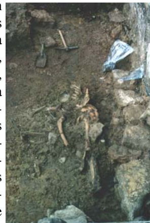
Enterramiento En laja y en fosa