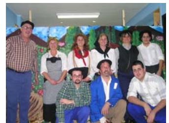
Función de el ERA- Avilés