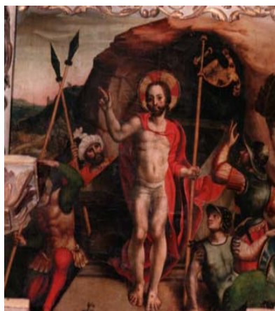
RESURRECCIÓN (Retablo de Llaranes)

En el retablo de Llaranes, la escena de la Resurrección aparece presidida por la figura de Cristo triunfante, de pie sobre la tapa del sarcófago, con nimbo crucífero, la mano derecha en actitud de bendecir y en la izquierda la Cruz de la salvación.