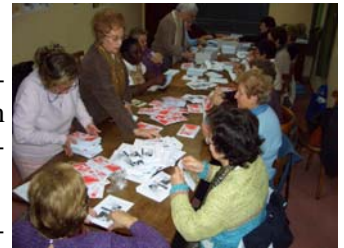
Organizando la Campaña de Navidad

Que el año 2007 signifique un avance en la promoción de la justicia y en la consecución de las aspiraciones más nobles de todos los seres humanos.