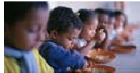
Reducir la pobreza y el hambre