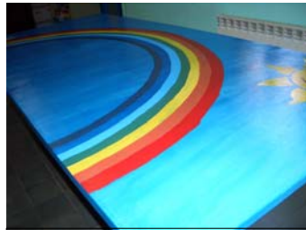
Mesa Proyecto Arco Iris