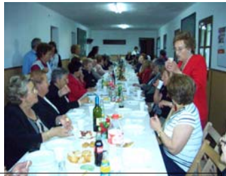
La Unción enfermos