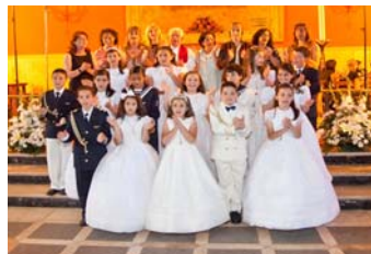
La Primera Comunión

¡MUCHAS GRACIAS A QUIENES LO HACÉIS POSIBLE CON VUESTRAS APOR- TACIONES!