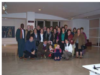
Asistentes al acto de reconocimiento a la labor voluntaria del pueblo de Llaranes