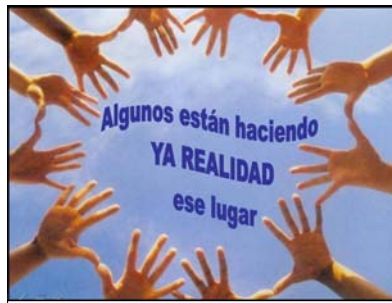
Cáritas somos todos