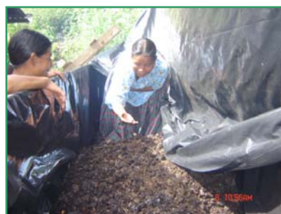
Explicando la Agricultura Ecológica en Guatemala

Además, a través del Equipo del Tercer Mundo de nuestra Cáritas parroquial, se envió este año a Guatemala: 18.400 €