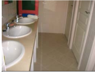
Obra en los baños