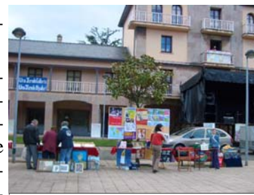
Detalles de la fiesta en la Plaza

Guatemala: "Tu ayuda + sus proyectos = su futuro".