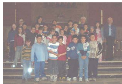
Foto en los ensayos de la celebración