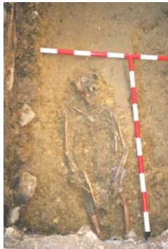
Enterramiento del Siglo XII