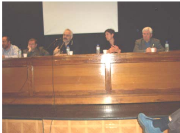
Mesa Redonda del día 18 de mayo de 2005

Conocer la historia, implicarse en ella y procurar evitar los errores que se han descubiertos, para abrirnos a un futuro mejor.