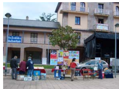
DOMINGO 24: ACTIVIDADES