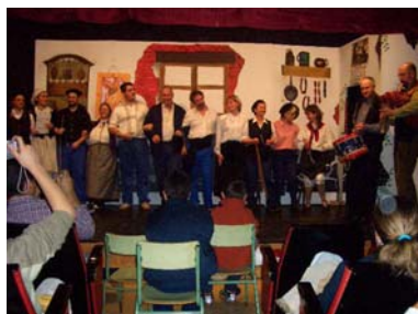
VIERNES, 22: “TEATRO”