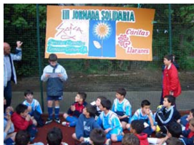
SÁBADO, 23: DEPORTES