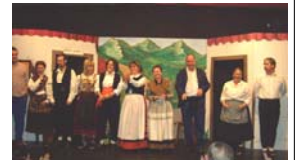
Santa Bárbara Teatro

Día 21: Teatro: Un año más, con el salón a rebosar, con un argumento gracioso y costumbrista, con historias, emociones, cuentos, refranes, amoríos, y picardía de la Asturias clásica, y con una interpretación, con un decorado típico de casería y pueblo asturiano, realizado por Jesús Suárez, el Grupo “Santa Bárbara Teatro” no deleitó con la representación de “El Boleru de Chano”.