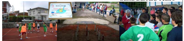
Jornada de deporte infantil : Baloncesto, bolos y fútbol

Día 22: Deporte. Más de 250 niños y niñas de Avilés y Comarca participaron en competiciones deportivas a lo largo de todo el día, usando el complejo deportivo Llaranes, con diploma como trofeo en el que se explica la realidad del pueblo Guatemalteco. Equipos, entrenadores, entidades, árbitros, organizadores... todos satisfechos por el éxito del día y por le finalidad de las competiciones y exhibiciones.