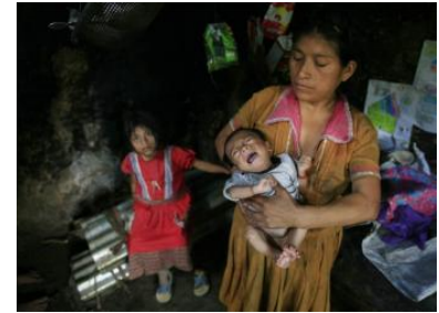
Madre portando niño famélico

Esto nos confirma que nuestra opción, como parroquia, por apoyar a las comunidades indígenas de este país debe ser intensificada si cabe.