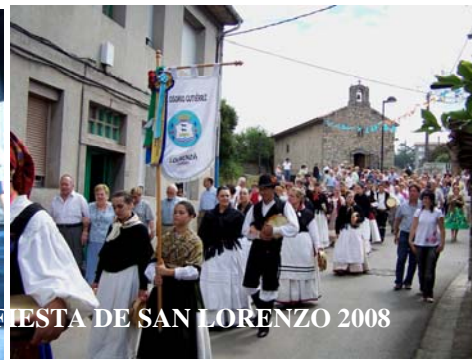
ALGUNAS IMÁGENES DE LA FIESTA DE SAN LORENZO 2008